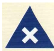
skrzyżowania i rozwidlenia dróg