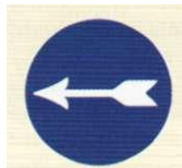
obowiązujący kierunek jazdy