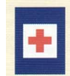
przydrożny punkt opatrunkowy