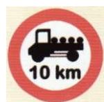
zakaz przekraczania normy szybkości przez samochody ciężarowe