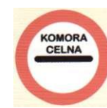
obowiązkowe zatrzymanie się przed komorą celną