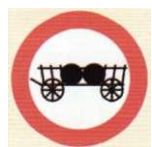
zakaz przejazdu konnych pojazdów ciężarowych