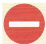
zakaz wjazdu przy jednokierunkowym ruchu