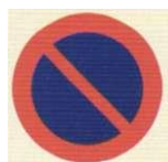
zakaz oczekiwania i zatrzymywania się pojazdów