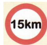
zakaz przekraczania określonej normy szybkości jazdy