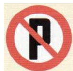
zakaz postoju pojazdów