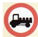
zakaz przejazdu samochodów ciężarowych