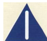
wszelkie inne niebezpieczne miejsca