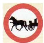
zakaz przejazdu konnych pojazdów