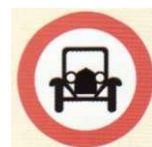
zakaz przejazdu samochodów