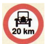
zakaz przekraczania normy szybkości przez samochody osobowe