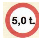
zakaz przejazdu pojazdów o wadze ponad określoną normę

szych miastach - jeśli krzyżują się dwie ulice, z których jedna jest główną, a druga boczna, to pojazd jadący ulicą główną, ma zawsze pierwszeństwo przed pojazdem posuwającym się ulicą boczną. Za ulice główne w znaczeniu powyższym uważa się te ulice po których biegną linie tramwajowe." Zasada ulicy głównej i bocznej początkowo obowiązywała w Warszawie, Lwowie, Krako-