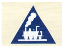
niezamykane przejazdy kolejowe